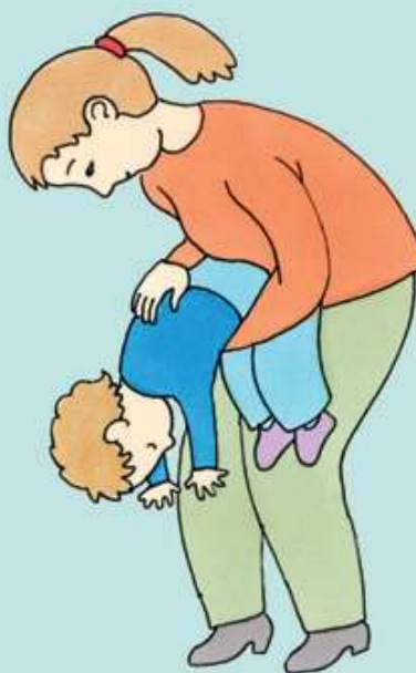
Hvis barnet er over 1 år

Ring 112, hvis du ikke kan få fremmedlegemet op, eller hvis barnet bliver bevidstløs.