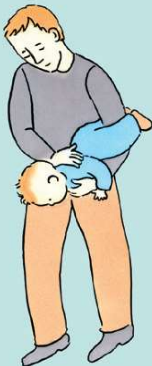
Hvis barnet er under 1 år

Hvis barnet er under 1 år og ikke trækker vejret eller ikke kan hoste, læg da barnet som vist på tegningen og giv 5 klask med flad hånd mellem skulderbladene. Hvis fremmedlegemet ikke kommer op, vend